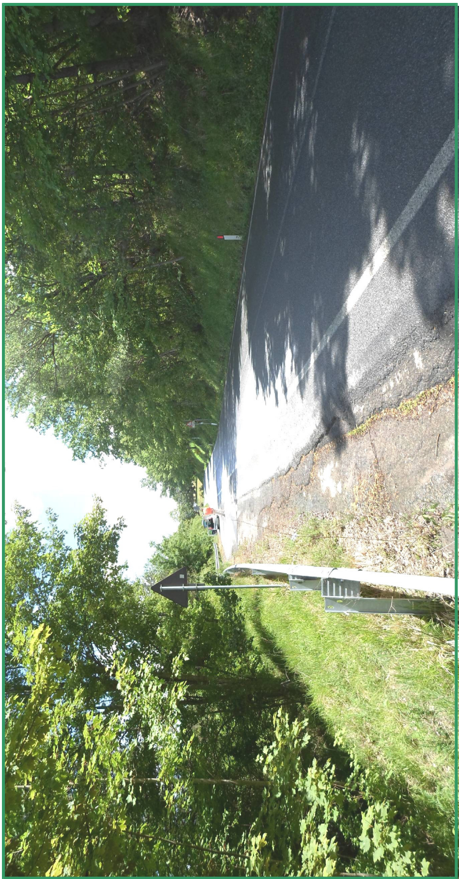
Area interessata dai lavori